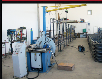
Lavorazioni in officina

Per operare nei vari settori la Ditta è dotata di: n° 3 Autovetture per assistenza e Pubbliche relazioni n° 3 Pulmini per il trasporto persone n° 2 Mezzi per il trasporto persone e cose n° 30 Saldatrici per saldature ad elettrodo, filo, tig, ecc... n° 5 Impianti per ossitaglio n° 4 Impianti per saldatura pressfitting n° 4 Banchi per piegatura tubazioni n° 3 Impianti per saldatura Polietilene e Polipropilene n° 3 Impianti per filettatura fino a 6" n° 20 Casse attrezzature complete di chiavi, trapani, mole, ecc. ed attrezzatura antinfortunistica. n° 3 Gruppi Elettrogeni di vari Kw n° 1 Segatrice a nastro per taglio tubi DN 350 n°1 Carrello elevatore OM Q.li 25