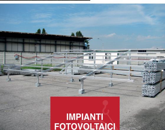
IMPIANTI FOTOVOLTAICI MAAP Padova e Due Carrare