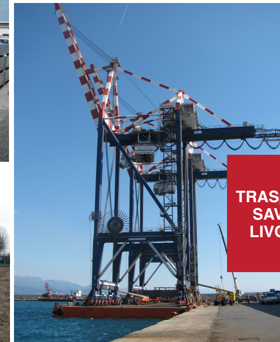
TRASPORTO SAVONA LIVORNO