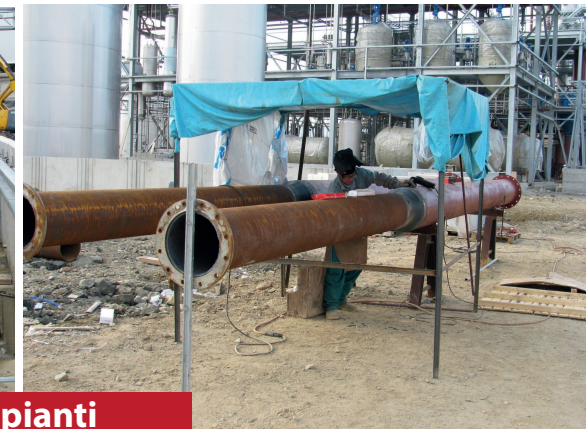
Cantiere Andreotti Impianti presso ILSAP di Lamezia Terme